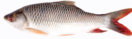
चित्र: रोहु माछा