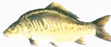
चित्र : कमन कार्प माछा (ईजरायली वा मिरर कार्प)