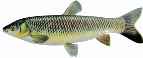
चित्र: ग्रास कार्पमाछा