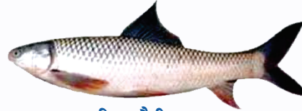
चित्र: नैनी माछा